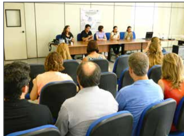
Seminário reforçou a importância que a Fatec dá para a área de pesquisa

Na parte da tarde, professores das Fatecs Jundiá, Ourinhos, Capão Bonito e Itu apresentaram seus projetos de pesquisa relacionados à educação profissional e tecnológica, tecnologias assistivas e tecnologias educacionais. Ao final, os pesquisadores presentes debateram sobre as condições institucionais para a pesquisa, sobre a consolidação e credenciamento dos grupos de pesquisa, sobre projetos interfatecs e os princípios norteadores de projeto temático a ser desenvolvido em parceria com a Faculdade de Educação da Unicamp.