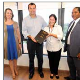
Entrega do trabalho ocorreu no Paço Municipal

Algumas vantagens do porto seco seriam agilidade na liberação de cargas, economia de custos e proximidade das autoridades aduaneiras.